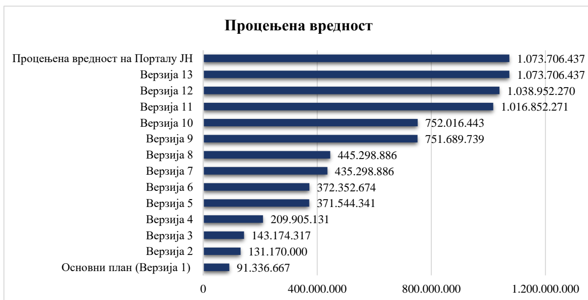
Табела број 2. Преглед планираних јавних набавки у 2022. години у динарима